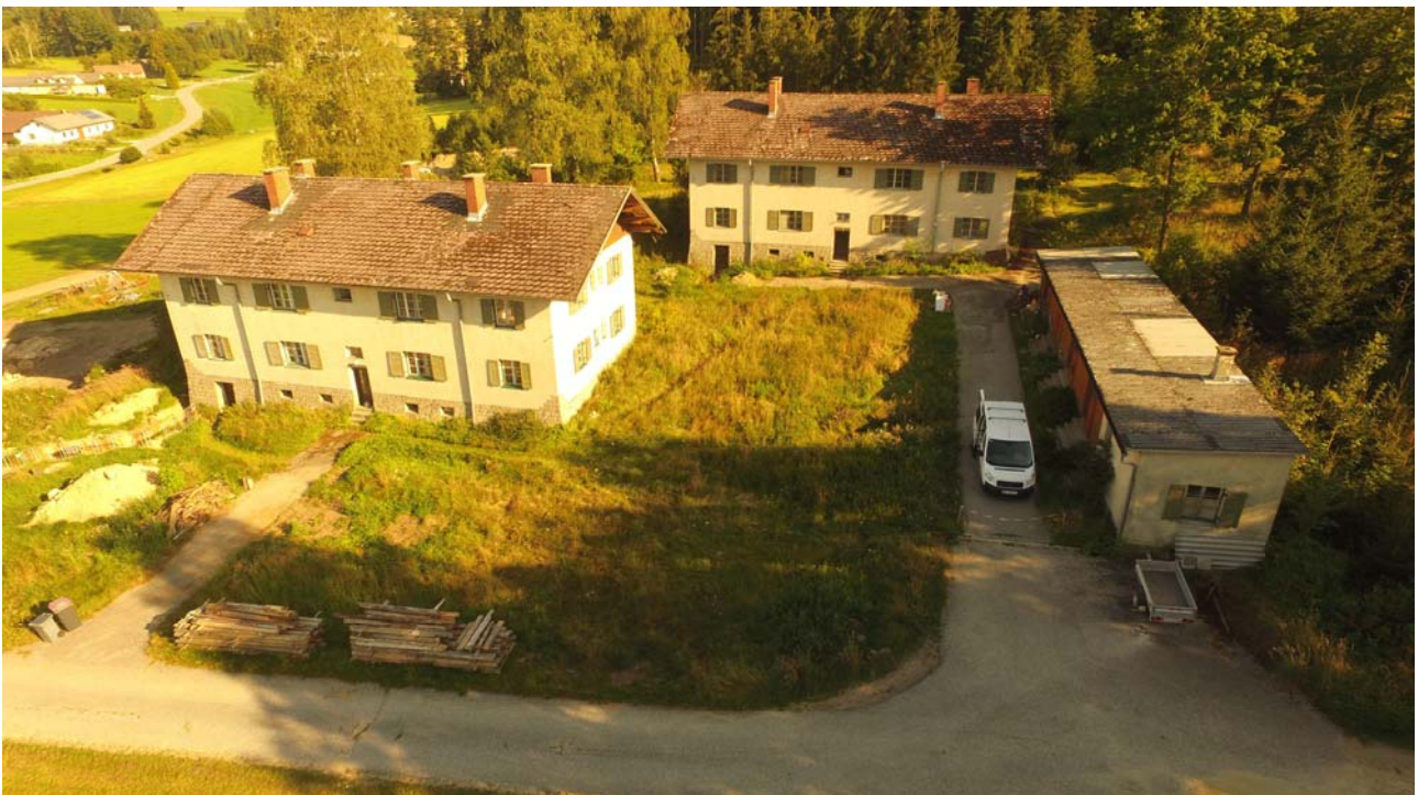
Beginn der Revitalisierung des Gebäudes im Jahr 2020.

Das Zentrum fördert internationalen Austausch zwischen Künstler:innen, Forscher:innen und lokalen Gemeinschaften und baut auf dem Netzwerk des Festivals Blockheide Leuchtet auf. Workshops, Vorträge und Kooperationen machen die Forschung öffentlich zugänglich und stärken die kulturelle Entwicklung der ländlichen Grenzregion.