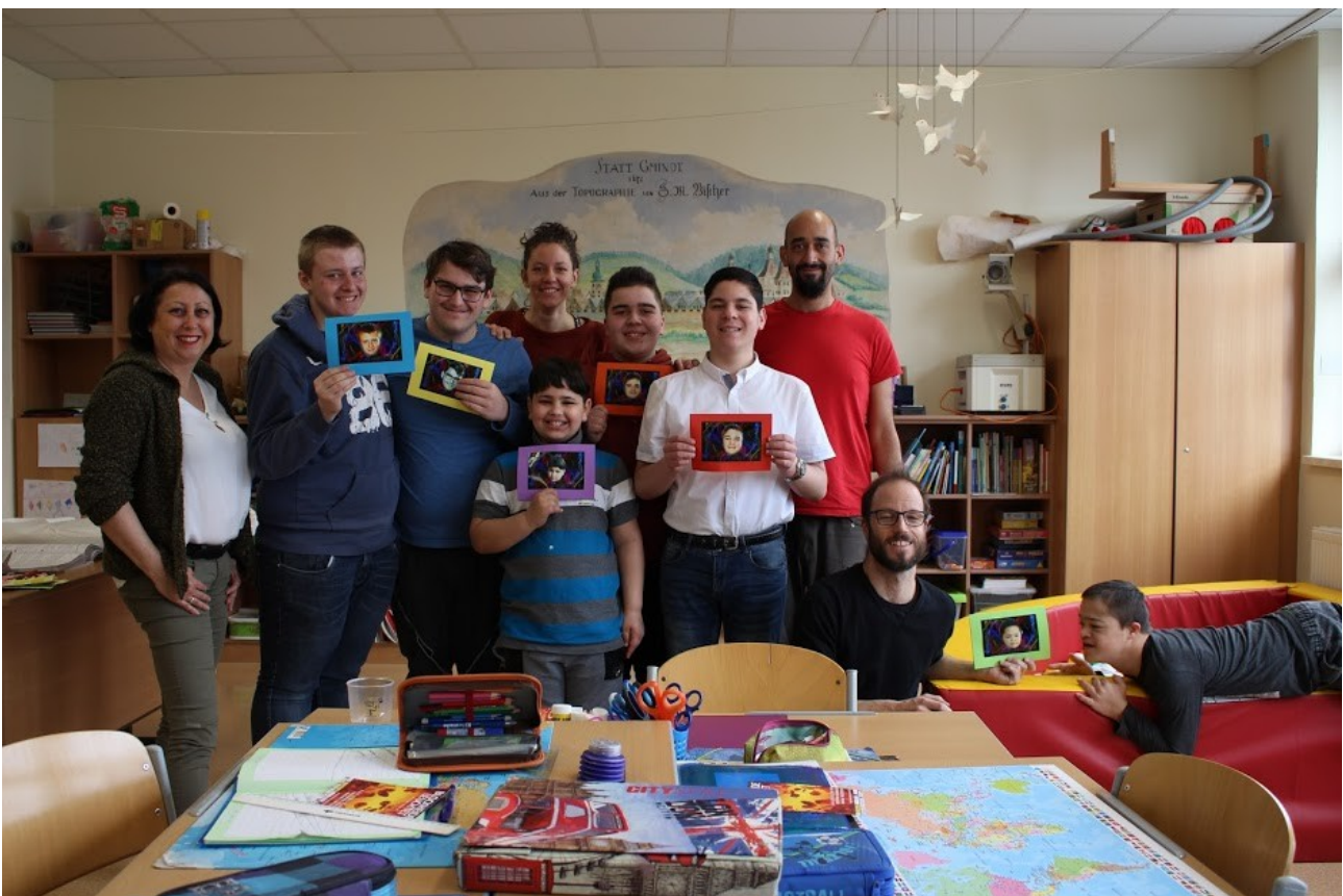
Präsentation der entstandenen „Lichtportraits“ und der gesammelten Gewinne aus der gemeinsamen Woche

In dem Projekt LICHTSPIELE ging es um eine kreative, liebevolle und spielerische Auseinandersetzung mit dem Thema Licht und dessen Möglichkeiten, sowie um eine wertfreie Beobachtung der Wirkungen auf die (schwerstbehinderten) Kinder. Gemeinsam wird eine lichtvolle Welt des Erlebens gestaltet.